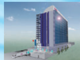
●SRDS 2 自動倉庫イメージ図

一度使用した展示ブースのディスプレイ什器や資材を専用倉庫で保管し、再使用できる状態に綿密なメンテナンスを施した後、必要な時にいつでも再使用できる「地球に優しい」ディスプレイシステムです。