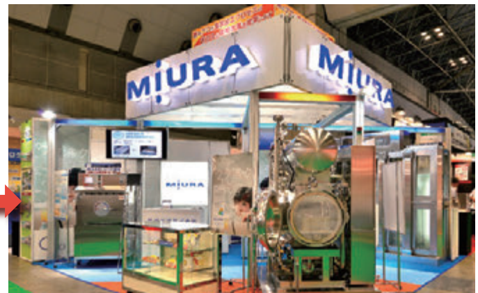
■FOOMA JAPAN 2013(2013年06月)