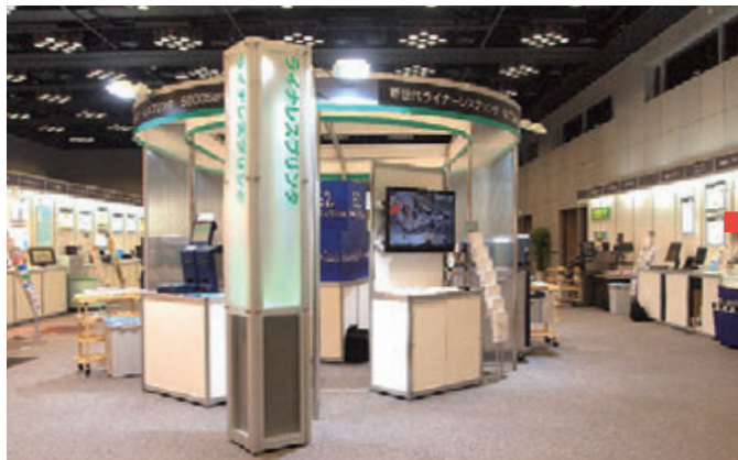
■寺岡精工様 大阪個展(2013年06月)