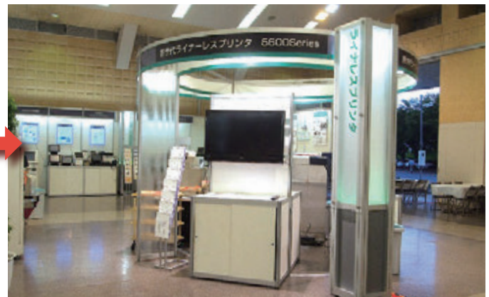
■寺岡精工様 長野個展(2013年07月)

SRDS 2 のお問い合わせ 東京本部 03-5646-1160 大阪本社 06-6624-3601 企画営業本部まで