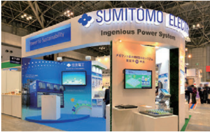
■(国際)スマートグリッドEXPO(2013年02月)